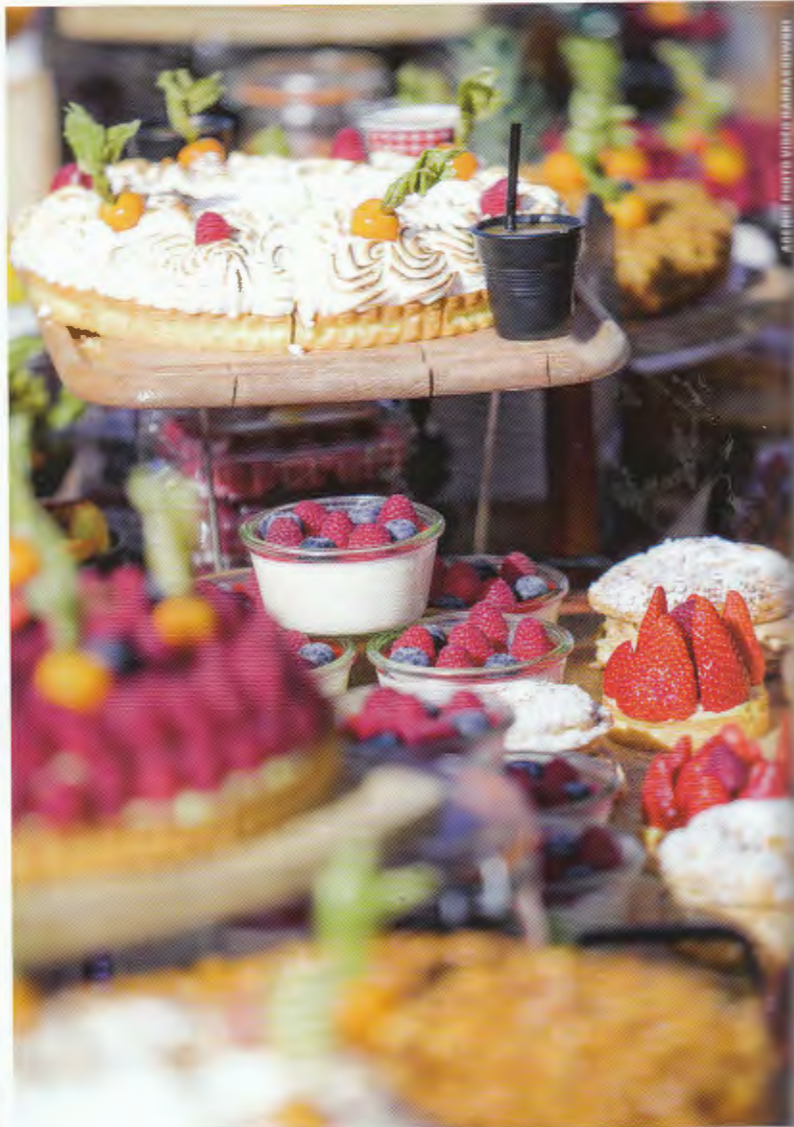
ARTISTE PHOTO VIVIER MARIE-HENRI